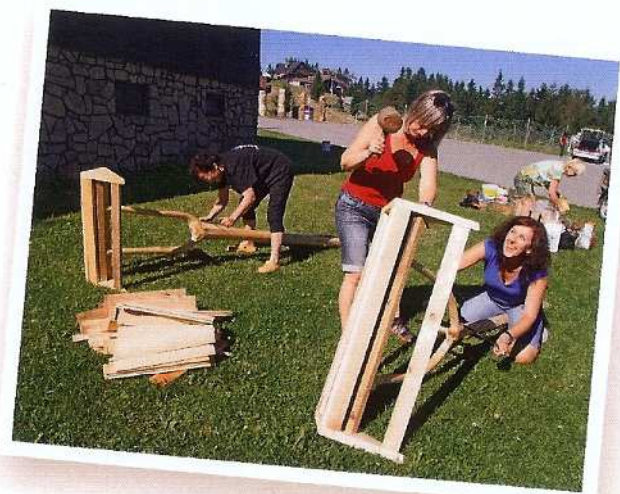
Na Kohútce se vyráběly také stylové turistické rozcestníky a ukazatele.

Na podporu pěší turistiky v Javorníkách pak navíc vyráběli také krytá posezení, rozcestníky, označnický i další drobnější dřevěné výrobky.