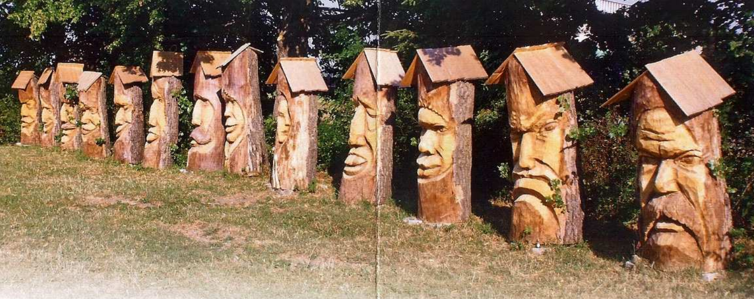
Monumentální družina dvanácti měsíčků na Pulčíně (s třináctým Měsícem československo-sovětského přátelství)

Na podporu pěší turistiky v Javorníkách pak navíc vyráběli také krytá posezení, rozcestníky, označnický i další drobnější dřevěné výrobky.