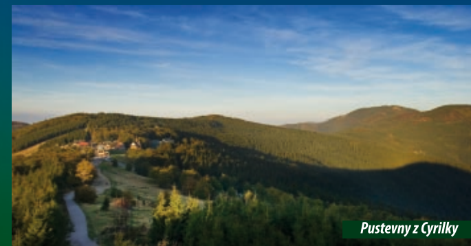
Pustevny z Cyrillky

Mystický duch Pusteven spojovaný s pověstmi o poustevnících a pokladech má reálný základ v existenci pseudokrasových puklinových jeskyní, které se vyskytují v celém masívu Radhoště, Čertova mlýna a Kněhyně. Nejbližší podzemní prostory se nacházejí východně od rozhledny Cyrillka. Tato stejnojmenná jeskyně je nejdelší pseudokrasovou jeskyní na Moravě s délkou chodeb 370 m. V hloubce osmi až dvanácti metrů pod povrchem, kde se většina chodeb nachází, je stálá teplota od čtyř do deseti stupňů Celsia při relativní vlhkosti vzduchu 90 %. V minulých letech se zde podařilo objevit vzácné druhy netopýrů, a to netopýra ušatého, vodního i vrápence malého, které patří mezi kriticky ohrožené a přísně chráněné živočichy. Na několika místech se zde vyluhováním vápinitého tmele z pískovců vytvořila pozoruhodná a pro pískovcové puklinové jeskyně velmi vzácká drobná brčka.