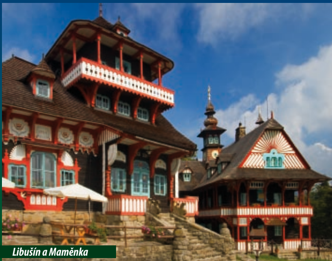
Libušín a Maměnka

Pustevny jsou významné turistické a lyžařské centrum v radhošťské části Beskyd. Nachází se v sedle mezi Radhoštěm (1129 m n. m.) a Tanečnicí (1084 m n. m.) ve výšce 1024 m n. m. Jsou dostupné veřejnou a individuální dopravou z Prostřední Bečvy nebo sedačkovou lanovou dráhou z Trojanovic. Z okolí Pusteven jsou překrásné výhledy na Javorníky a Vsetínské vrchy. Za